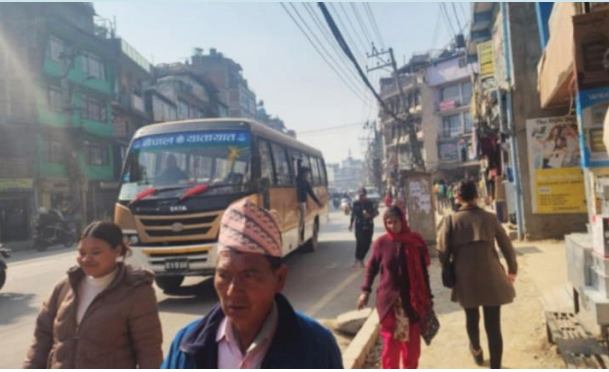
सहरी प्रदूषण । चाहबिल क्षेत्र, काठमाडौँ, माघ २०८१

केही वर्षअघिसम्म काठमाडौँ एकदम सफा र हरियाली थियो । तर अहिले खोलाहरू सुकेका र फोहोर भएका छन् – गाडीहरू धेरै, धुवाँ-धूलो धेरै । मास्क नलगाई त हिँड्नै सकिँदैन, धेरैले लगाउँछन् । मलाई त कुराकानी गर्न नै गाह्रो हुन्छ किनभने मेरो सुनाइसम्बन्धी अपाङ्गता छ, म ओठको हाउभाउ र अनुहारको भावले बोल्छु, अनुहारको भाव हेरेर मात्रै कुरा बुझ्छु । मास्कले त्यो पनि छोपिन्छ ।