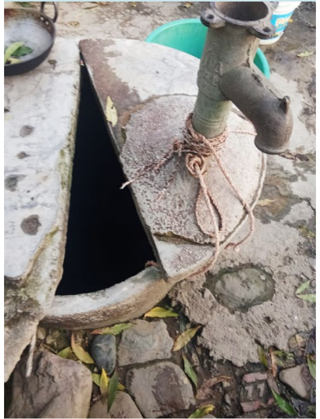
सुकेको इनार । सुर्खेत जिल्ला, कर्णाली प्रदेश, पौष १८, २०८१

मैले हाम्रो इनारको फोटो खिचें । खडेरी र अनियमित वर्षाका कारण इनार सुकेको छ । अहिले हामीले पानी किन्नुपर्छ । पहिले बिना पैसा पानी प्रयोग गर्न पाइने इनारमा अहिले किराफट्याङ्ग्रा भरिएका छन्, अलिअलि पानी छ तर त्यो पनि फोहोर । हामीले पचास रूपैयाँ पर्ने पानीका जार किन्नुपर्छ, र दैनिक दुई—तीन जार सकिन्छ, यो धेरै खर्चिलो भएको छ । यो सबै जलवायु परिवर्तनले गर्दा भएको हो ।