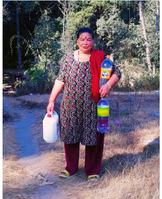
पानी ल्याउन धाउनुपर्ने बाध्यता । चापागाउँ, गोदावरी नगरपालिका (ललतिपुर जिल्ला), पुष २४, २०८१

हाम्रो घर राजधानीमै छ, तर मेरी आमा पानी ल्याउन टाढा जानुपर्छ । पानीको अभाव एउटा ठूलो समस्या बनेको छ । मलाई गम्भीर अपाङ्गता छ, व्हीलचेयरमा पनि हिँडडुल गर्न आमामै सहारा चाहिन्छ । उहाँ पानी लिन जाँदा वा कतै बाहिर जाँदा म एकलै हुन्छु, निकै गाह्रो हुन्छ । छोरी भएर मैले पनि आमाको बोझ बाँड्न र पानी ल्याउन सहयोग गर्न चाहन्छु, तर सक्दिनँ । यो कुराले मलाई सधैं दुःखी बनाउँछ ।