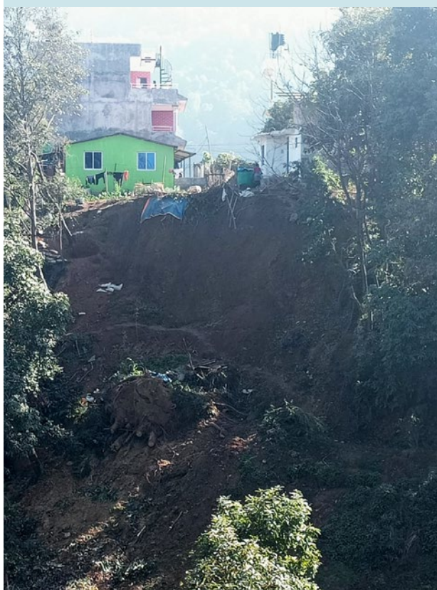
घरलाई जोखिममा पारेर गएको पहिरो । गोदावरी नगरपालिका, ललितपुर जिल्ला, पुष २२, २०८१

मैले सोचेको पनि थिइँनँ मेरो घरको यति नजिक पहिरो जाला भनेर । अहिले यो मेरो घर हो, र पहिरोले घरको ठीक यो छेउको माटो बगाएको छ । मलाई अहिले कतिखेर के हुने हो भनेर निकै डर लाग्छ । यसले मेरो मानसिक स्वास्थ्य समस्या फेरि बल्लिँएको छ, र निको भएपछि छोडेको औषधि फेरि खान थाल्नुपरेको छ ।