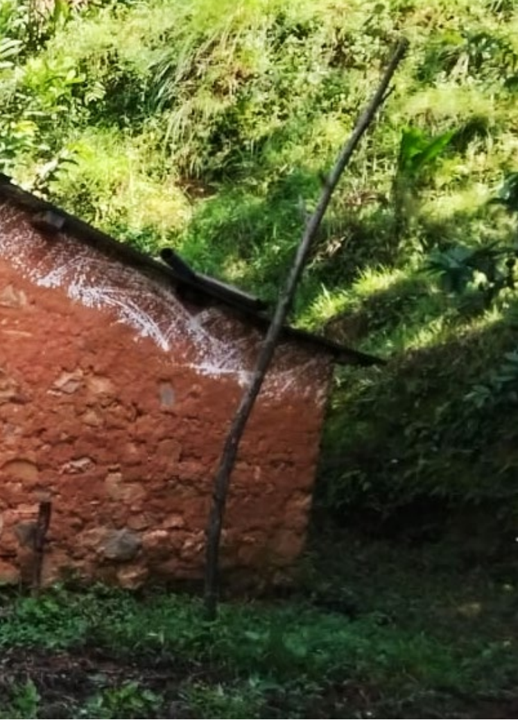
p. 3/4: पश्चिम रुकुम, कर्णाली प्रदेशमा रहेको अस्थायी आश्रय (शौचालय, भान्सा र बसोबास कोठा), डिसेम्बर २०२४।

जलवायु कार्यमा अपाङ्गता भएका महिलामाथि हुने अन्तरक्षेदिय विभेद न्यूनीकरणका लागि समन्वयात्मक प्रयास गरेर यी खोजनतिजाहरूको सम्बोधन गर्न सकिन्छ । केही उपयोगी उपायहरू यस प्रकार छन् :