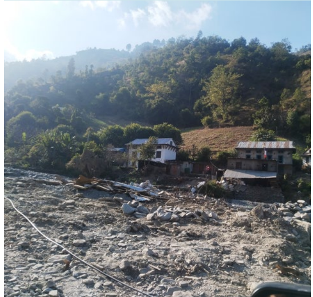
बाढीले क्षति गरेका घर र बाटोघाटो । रोशी गाउँपालिका, काभ्रे जिल्ला, पौष ८, २०८१

हामीले कहिल्यै सोचेका थिएनौँ, रोशी जस्तो सानो देखिने खोला यति ठूलो बनेर यत्रो विनाश गर्छ भनेर । सायद यही हो कि जलवायु परिवर्तन । मेरो घर त्यो गाउँको ठीक पछाडि छ, तर म त्यहाँ पुग्न सक्दिनँ ।