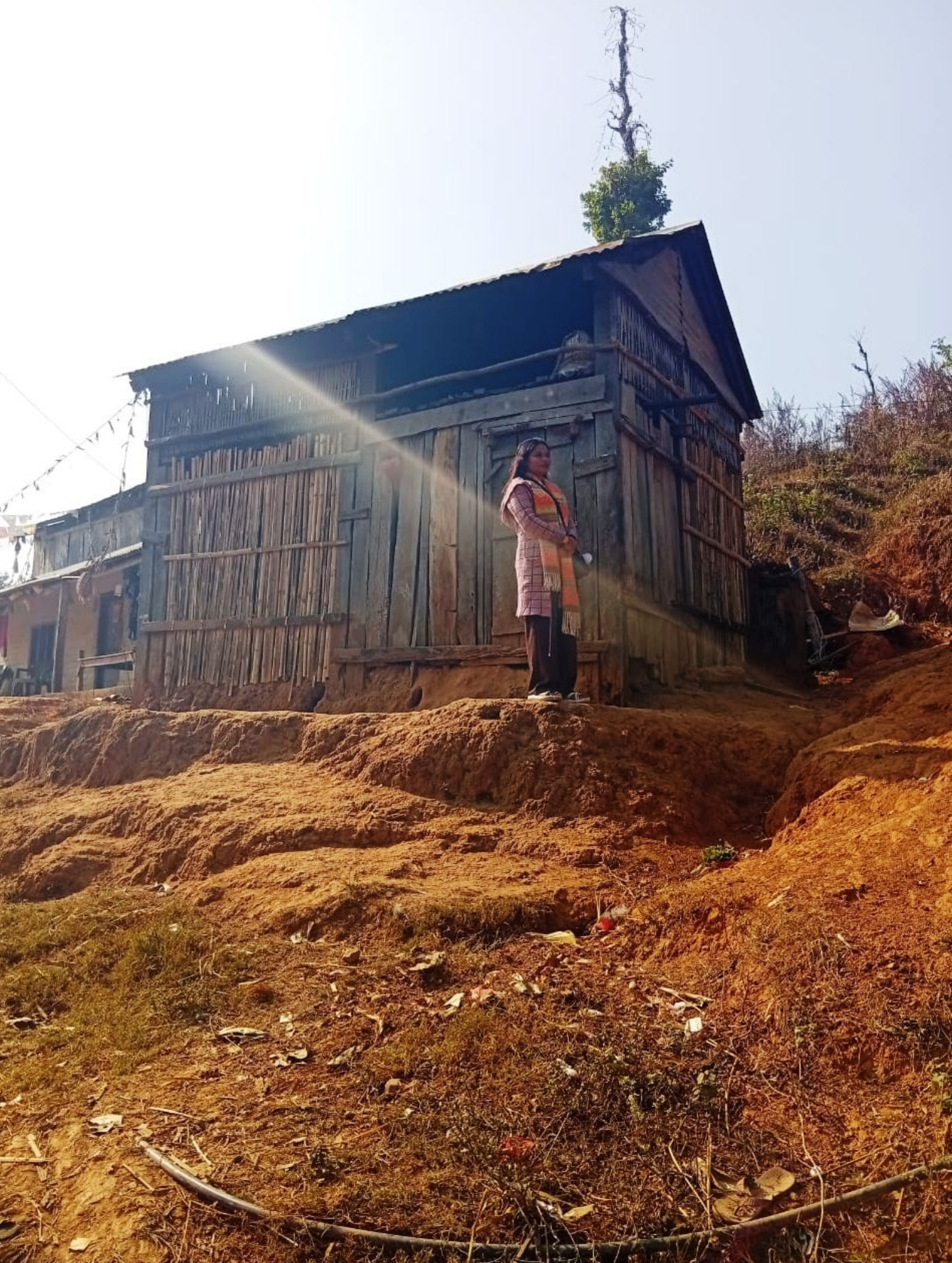
बागमती प्रदेशको राप्ती नगरपालिकामा घरहरूलाई जोखिममा पाउँ गरेको कटान, डिसेम्बर २०२४।